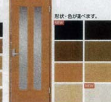
形状・色が選べます。