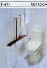
ECC6 2日でお風呂1杯分以上節約できます。