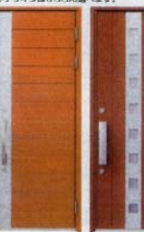
断熱玄関ドア 色・デザインはいろいろ選べます。