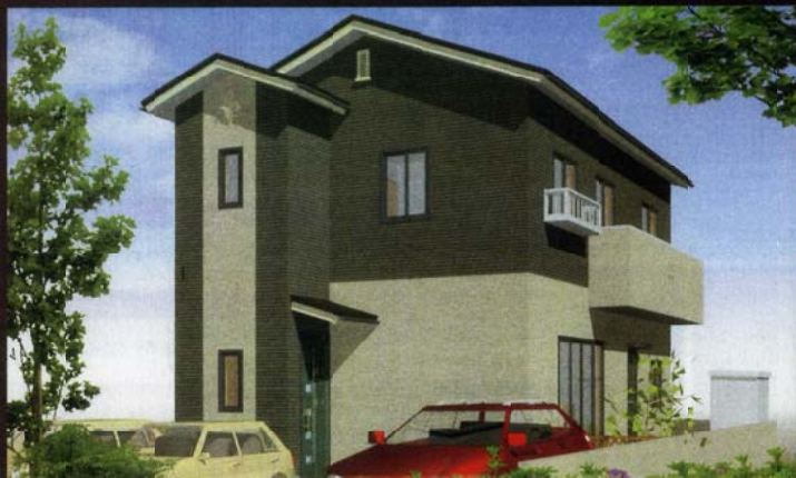
打ち合わせ時パースです。実際の仕上がりをぜひご確認下さいませ!