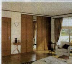
クラックレスフローア