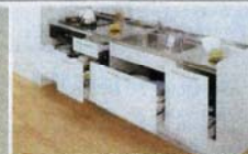
ハンドエアースライド収納